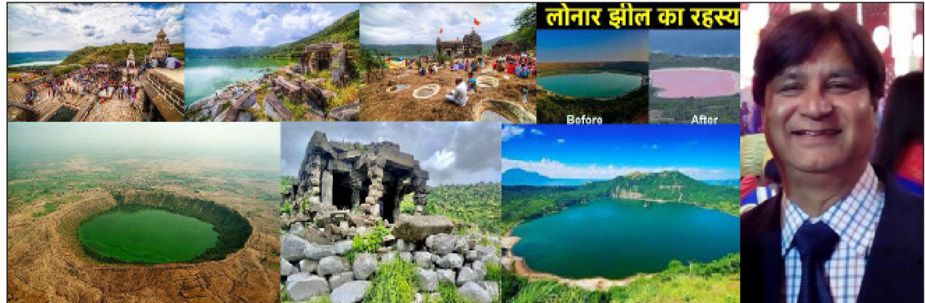
लोनार झील का रहस्य

बखूबी दर्शाते हैं। अभी भारतीय वैज्ञानिकों के साथ-साथ नासा के वैज्ञानिक भी इस झील के रहस्यों को सुलझाने में लगे हैं। अभी और भी कई बातों का सामना आना बाकी है, क्योंकि इस झील से जुड़ा एक रहस्य खुलता है, तो उसके साथ एक और नया रहस्य सामने आ जाता है। इस संबंध में न केवल भारत सरकार ही नहीं बल्कि दुनिया भर के वैज्ञानिक खोज में लगे हुए हैं। भारत और अमेरिका के भूगर्भ सर्वेक्षण विभाग, नासा से